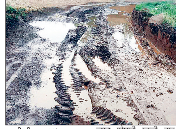
हरिभूमि न्यूज ►►बरबसपुर

जिला मुख्यालय के ग्राम पंचायत बरबसपुर की आश्रित ग्राम बीजाड़ोरी के रहवासियों को मूलभूत सुविधाओं के अभाव में भारी दिक्कतों व परेशानियों का सामना करना पड़ रहा है। ग्राम बीजाड़ोरी में पक्की नाली व सड़क के अभाव में ग्रामीणों व राहगीरों को आवाजाही में दिक्कतें के कारण ग्राम के बीचों-बीच बहने के कारण सड़क में जल भराव तथा कीचड़ से लथपथ होने के कारण आवागमन दुभार हो गया है। जिससे रहवासियों व सबसे ज्यादा परेशानी स्कूली छात्र-छात्राओं को उठानी पड़ रही है। ग्राम बीजाड़ोरी में बुनियादी सुविधाओं व विकास कार्यों के अभाव में ग्रामीणों की मुश्किलें और बढ़ गई हैं। ग्रामीणों ने इन सभी समस्याओं को लेकर दिक्कतों व परेशानियों का सामना प्रशासन को कई बार शिकायत की गई लेकिन जिम्मेदारों व जनप्रतिनिधियों की भारी अनदेखी के कारण ग्राम के रहवासियों को बुनियादी सुविधा का लाभ नहीं मिल पा रहा है। जिस पर ग्रामीणों ने शासन प्रशासन से प्रधानमंत्री सड़क नव-निर्माण कार्य की मांग की गई ताकि ग्रामीणों व क्षेत्रवासियों को कीचड़ से लथपथ सड़क से निजात तथा बुनियादी सुविधाएं उपलब्ध हो सकें।