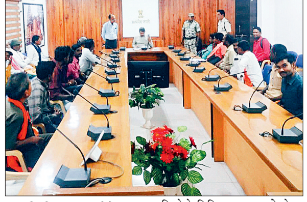
हरिभूमि न्यूज ►►कोलेगाव